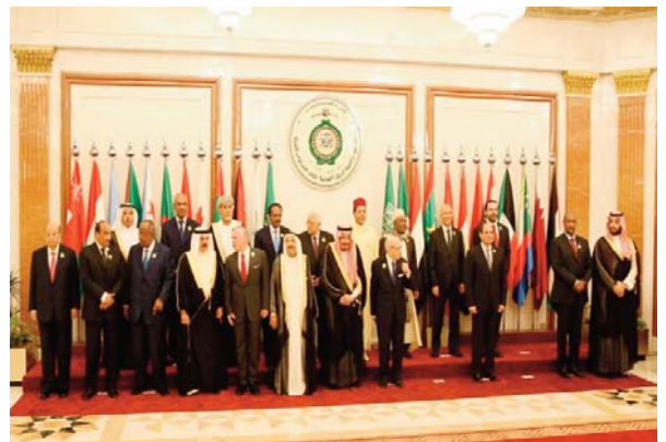
Les dirigeants arabes attachés à la paix et à la stabilité

L'Emir du Koweït, cheikh Sabah al-Ahmad Al-Sabah a aussi réaffirmé que tout plan de paix doit reposer sur la base d'un Etat palestinien, avec pour capitale Al Qods. Dans son allocution, le président palestinien Mahmoud Abbas a précisé que la partie palestinienne ne prendra pas part à l'atelier de paix prévu à Bahreïn à l'appel des Etats Unis et de Manama.