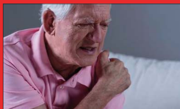
la Société Française de l'Etude et du Traitement de la Douleur. Douleurs articulaires,