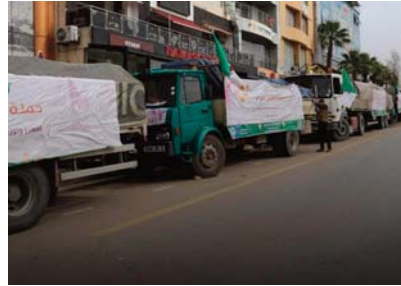
Il a ajouté que «le choix de lancer cette caravane au début de la dernière décennie de ce mois sacré a