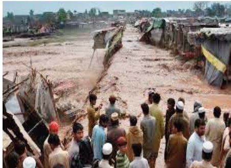
causé des milliards de dollars de dégâts à l'économie du pays et certaines des régions qui ont perdu leur logement vi-

Les pluies et les inondations de 2022 ont également