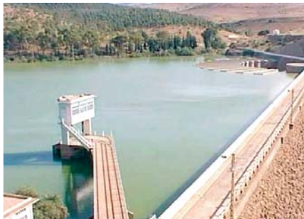
duré 4 mois en raison des difficultés rencontrées par les agents de l'ADE. Selon le même responsable, cette

M. Saharaoui a également précisé que ses services sont intervenus pour réhabiliter cette conduite, suspendue il y a 3 ans en raison de plusieurs dysfonctionnements, soulignant que la période de réparation a