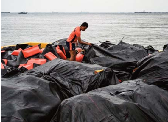
Le naufrage du MT Terra Nova s'est produit alors que de fortes pluies alimentées par le typhon Gaemi et la mousson saisonnière ont frappé Manille et les régions environnantes ces derniers jours.

Des vues aériennes ont permis de constater que la nappe de pétrole avait considérablement diminué en taille, passant de 14 à 6,4 kilomètres, a-t-il ajouté. Le siphonnage des 1,4 million de litres d'hydrocarbures de la cale du navire, qui repose à 34 mètres de fond, débutera mardi.