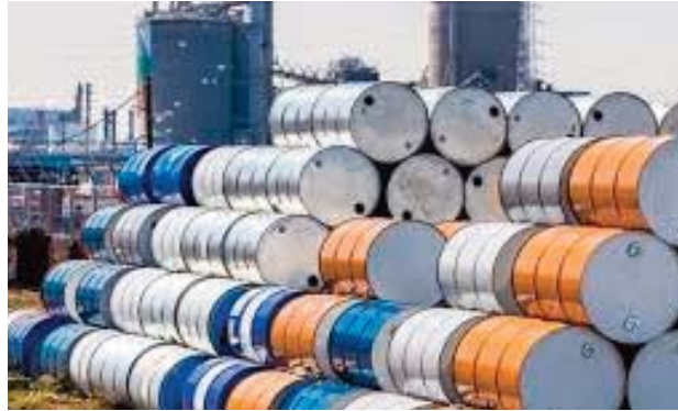
de mètres cubes par jour sera atteint en 2031. Le Brésil produisait 150 millions de mètres cubes de gaz par jour en 2023.