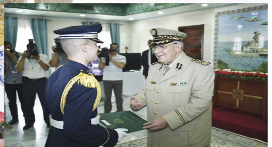
Cérémonie en l'honneur des meilleurs lauréats des Cadets de la Nation au Baccalauréat et au BEM, session juin 2019