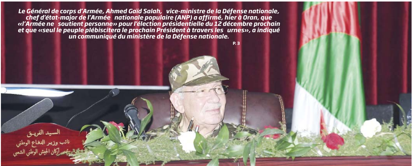
2 e jour de la visite du Général de corps d'Armée, Ahmed Gaïd Salah, vice-ministre de la Défense nationale, chef d'état-major de l'ANP à la 2 e Région militaire à Oran