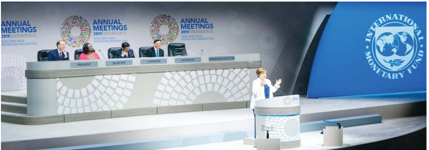
Assemblées annuelles du Groupe de la Banque Mondiale (BM) et du Fonds Monétaire International (FMI) prévus du 17 au 20 octobre à Washington