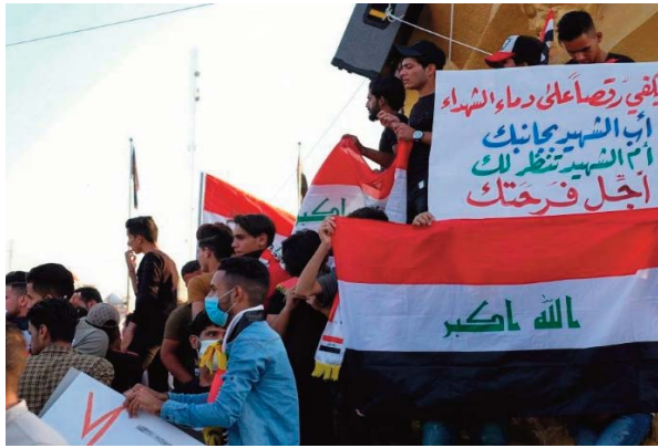
Nouvelles violences à Baghdad où la contestation se poursuit

L'Espagne vit une situation d'instabilité politique depuis que le bipartisme a volé en éclats en 2015 avec l'entrée en force au Parlement de Podemos et de Ciudadanos.