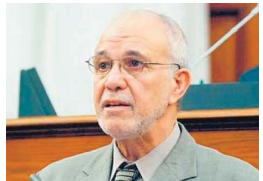
matation à distance au profit de l'ensemble des intervenants dans le processus électoral «pour éviter toute entrave ou obstacle le jour du scrutin», indiquant que ce genre de formation par vidéoconférence sera destiné prochainement aux délégués de l'autorité à l'étranger.