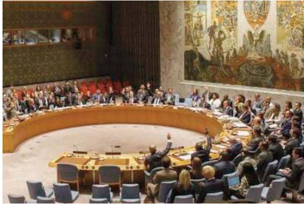
Banque africaine de développement groupe, a enfin indiqué l'ONU sans donner d'échéance pour la remise de leurs conclusions.

L'Italienne Federica Mogherini, ex-chef de la diplomatie européenne, et le Rwandais Donald Kaberuka, ancien président de la