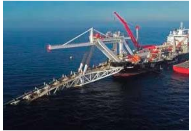
Stream sont entrées en vigueur le 20 décembre, provoquant notamment la suspension des travaux de construc-

Les sanctions américaines contre les projets Nord Stream 2 et Turkish