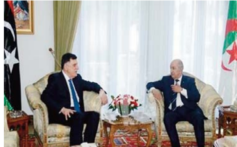
des Affaires étrangères, Mohamed Taher Siala, et du ministre de l'Intérieur, Fathi Bachagha.

l'Intérieur, des Collectivités locales et de l'Aménagement du Territoire, Kamel Beldjoud. La rencontre entre MM. Tebboune et El-Serraj "s'inscrit dans le cadre des concertations permanentes entretenues avec les frères libyens et permettra d'échanger les vues sur l'aggravation de la situation en Libye et d'explorer les voies susceptibles de surpasser cette conjoncture difficile", avait indiqué un communiqué de la Présidence de la République. M. El-Serraj est accompagné, lors de sa visite, du ministre