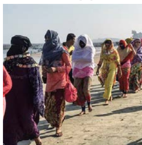
Saint-Martin, proche des côtes du district de Cox's Bazar (sud-est) où près

Les 138 passagers, principalement des femmes et des enfants, étaient montés à bord d'une embarcation de pêche longue d'à peine 13 mètres dans l'espoir de gagner la Malaisie par le golfe du Bengale, un voyage de 2.000 kilomètres. Le naufrage a eu lieu à proximité de l'île bangladaise de