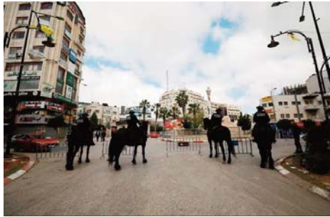
L'annexion des colonies israéliennes et de la Vallée de Jourdain a été proposée dans un plan de paix de Donald Trump, rejeté par les Palestiniens.

"J'engage fermement les dirigeants israéliens et palestiniens à prendre des mesures vers la paix, à rejeter les mouvements unilatéraux qui ne feront qu'approfondir le fossé entre les deux peuples et saper les chances de paix", a-t-il ajouté.