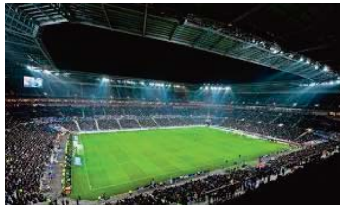
Le Championnat d'Angleterre de football (Premier League) pourrait reprendre le 8 juin, à huis clos, et s'achever le 27 juillet, rapporte samedi le journal britannique

The Times. Les dirigeants de la Premier League, associés à des représentants d'autres sports, ont discuté avec le gouvernement pour déterminer le cadre d'une reprise.