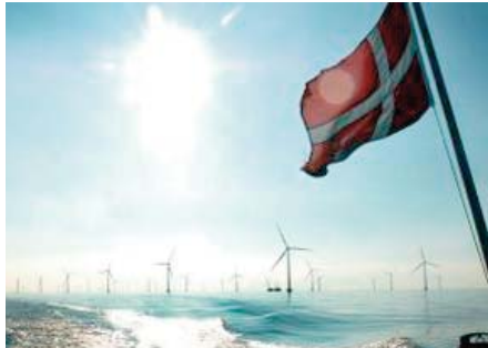
ses émissions de CO2 à l'horizon 2030. L'accord, négocié par tous les partis à l'exception d'une petite forma-

Copenhague avait déjà annoncé que le pays scandinave, pionnier de l'éolien, allait diminuer de 70%