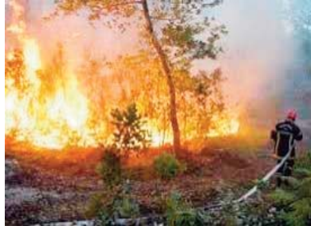
d'importantes surfaces sylvicoles et des hectares de plantations arboricoles, lors de ces différents incendies.

km à l'ouest de Médéa, alors qu'il est fait, en outre, de la destruction de deux autres parcelles, de maquis et de broussaille, respectivement à "Guemana", commune de Si-Mahdjoub, et "Cherata", dans la commune de Berrouaghia, à l'ouest et est du chef lieu de wilaya, signale la même source. De petites plantations arboricoles et des équipements d'irrigation ont été réduits en cendre, durant l'incendie qui s'est produit, samedi, à "Cherata", a-t-on ajouté, précisant que le déploiement rapide des équipes d'intervention a permis de limiter les dégâts et préserver