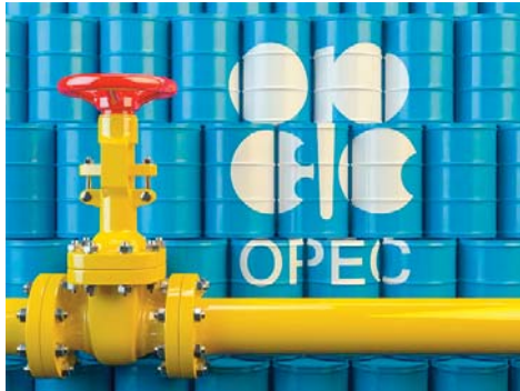
dernier rapport mensuel de l'Opep. Sur une base mensuelle, l'ORB a augmenté de 7,51 dollars à 25,17

Sa valeur avait rebondi en mai, la première augmentation mensuelle depuis décembre 2019, reflétant des gains dans les principaux repères, car l'offre mondiale de pétrole a diminué et la demande de pétrole brut a commencé à s'améliorer progressivement au milieu de l'assouplissement des contraintes liées au COVID-19, selon le