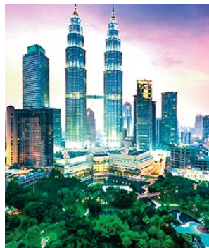
a rendu quasi-impossible la réalisation de cet objectif très ambitieux.