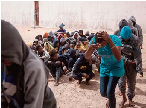
les groupes armés et les trafiquants, y compris le raid sur un réseau de passeurs et le gel des avoirs de divers trafiquants. Le

"Il a été bien documenté ces dernières années que des groupes criminels de passeurs et de trafiquants opèrent en Libye, causant d'immenses souffrances et misères", selon le communiqué. Le HCR a salué les récentes mesures prises par les autorités libyennes contre