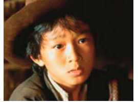
Indiana Jones et le temple maudit

A Shanghai, en 1935, l'aventurier et archéologue Indiana Jones négocie l'acquisition d'une pierre magique avec le caïd Lao Che. Mais le ton monte entre les deux hommes. Aidé par un enfant chinois surnommé Demi-Lune, Indiana Jones prend la fuite en compagnie la chanteuse américaine Willie Scott. Tous trois sont contraints de quitter la ville à bord d'un avion de fortune, puis forcés d'atterrir en Inde.