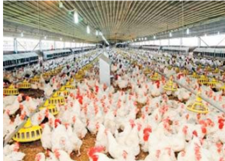
tion de sections de la formation en aviculture au niveau des centres de la formation professionnelle de la wilaya a-t-on conclu de même source.

viande blanche a encouragé l'activité de la roûisserie, de plus en plus prisée à M'sila, notamment ces trois dernières années, avec l'entrée en activité de plus de 500 commerçants spécialisés dans ce domaine, a-t-on noté. La filière avicole est appelée à connaître, au cours des prochaines années, "un dynamisme accru" susceptible de transformer la wilaya en pôle national d'aviculture à même de générer près de 4.000 emplois liés à cette activité, ont rappelé les services de la wilaya. La filière sera prochainement appuyée par la créa-