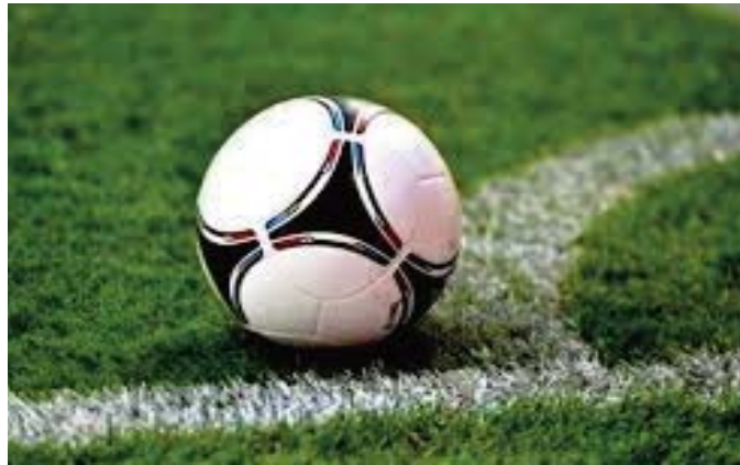
La seconde partie de sa préparation estivale en effectuant à partir de mercredi un stage de 12 jours à Mostaganem. Les autres clubs de Ligue 1 n'ont pas encore communiqué les dates officielles de reprise des entraînements.

Le CR Belouizdad, champion d'Algérie en titre, a repris les entraînements lundi en fin de journée à Alger après six mois d'arrêt en raison de la pandémie de coronavirus, tandis que la JS Kabylie qui a déjà bouclé samedi son premier stage de préparation à Akbou (Béjaïa), entamera