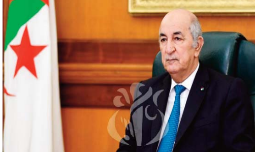
ber Al-Sahab et du président de la République populaire de Chine, M. Xi Jinping", lit-on dans le communiqué.

Le Président de la République, M. Abdelmadjid Tebboune a reçu, lundi, deux messages de vœux de prompt rétablissement de la part de l'Emir de l'Etat du Koweït, Cheikh Nawaf Ahmad Al-Djaber Al-Sahab et du président de la République populaire de Chine, Xi Jinping, indique un communiqué de la Présidence de la République. "Le Président de la République, M. Abdelmadjid Tebboune a reçu, lundi, deux messages de vœux de prompt rétablissement de la part de l'Emir du Koweït, Ckeikh Nawaf Ahmad Al-Dja-