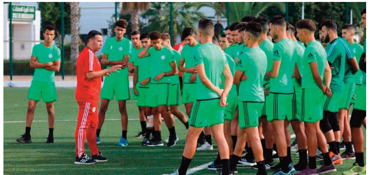
Le sélectionneur Saber Bensmaïl (à gauche) s'adresse aux joueurs de la sélection algérienne U20 lors d'un stage de préparation au Centre technique national (CTN) de Sidi-Moussa.

Outre le travail physique et technico-tactique, les U20 ont disputé plusieurs matchs amicaux, contre des équipes du centre, notamment, la JS Kabylie, le CR Belouizdad, le MC Alger, le Paradou AC et l'USM Alger. Les stages de la sélection nationale U20 entrent dans le cadre de la préparation du prochain tournoi de l'Union nord-africaine de football, prévu du 13 au 28 décembre en Tunisie, et qui sera qualitatif pour la prochaine Coupe d'Afrique des nations de la catégorie (CAN-2021), prévue du 14 février au 4 mars en Mauritanie.