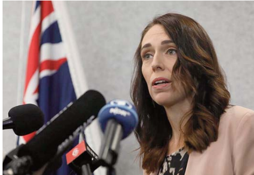
L'efficacité de la réponse de l'archipel à l'épidémie a été saluée à

La Nouvelle-Zélande a fermé ses frontières en mars et depuis lors, tous les visiteurs, y compris les Australiens, doivent se plier à deux semaines de quarantaine.