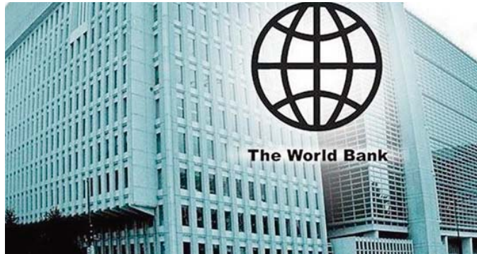
ans, selon la BM. La Banque mondiale (BIRD et IDA) veillera également à ce que 50 % de ces financements soutiennent l'adaptation et la résilience.

Un objectif ambitieux qui vient se substituer à une cible initiale de 28 % à l'horizon 2020, en vigueur depuis cinq