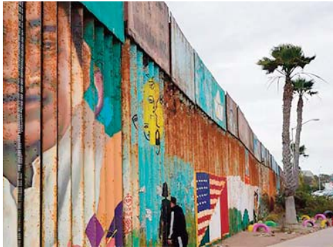
confins de l'Etat du Nuevo Leon, Miguel Aleman, ville de 20.000 habitants, juxta la ville américaine de Roma

Aucune douille n'ayant été trouvée sur place, le parquet n'exclut pas que les victimes aient pu être tuées dans un autre endroit. Située aux