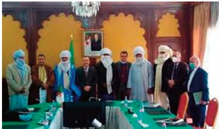
clavement et le développement de ces zones, note la source.

Lors de cette rencontre consacrée à l'écoute des préoccupations soulevées et l'examen des meilleurs moyens pour la prise en charge urgente des zones enclavées et frontalières, M. Berraki a relevé l'intérêt suprême accordé par le président de la République, Abdelmadjid Tebboune, au dossier du développement des zones d'ombre à travers l'ensemble du territoire national, notamment les régions du Sud, soulignant l'importance des solutions optimales pour le désen-