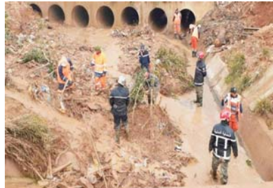
L'aménagement du territoire, des Ressources en eau, du Commerce, ainsi que de la Solidarité nationale, de la Famille et de la Condition de la

Le chef de l'Etat a chargé, à cette occasion, une délégation ministérielle composée des ministres de l'Intérieur, des Collectivités locales et de