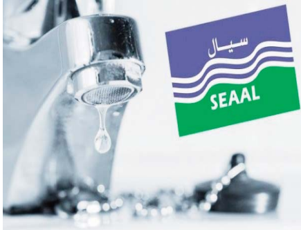
de Oued Korich. La société a précisé que la remise en service de l'alimentation en eau potable se fera progres-

Ces travaux, localisés dans la commune d'Alger-centre, engendreront une perturbation de l'alimentation en eau potable, qui impactera en partie les communes d'Alger-centre, de Bab El Oued, de la Casbah, de Bologhine ainsi que la totalité de la commune