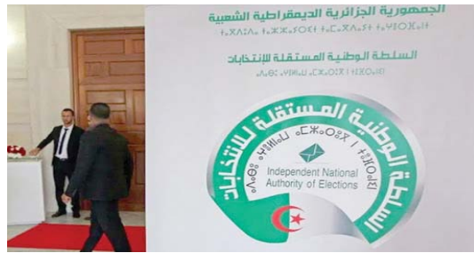
"Conformément aux dispositions de l'article 202, ce dernier procède au contrôle des signatures et s'assure de leur validité et en établit un

nion de ces conditions "habilite le parti concerné à déposer sa liste de candidats auprès des Délégations de l'ANIE à travers l'ensemble des circonscriptions électorales au niveau des 58 wilayas", ajoute le document. A près la finalisation de l'opération de collecte des signatures au niveau des wilayas "les imprimés remplissant les conditions légales sont présentés pour certification au président de la Commission électorale de la circonscription électorale, visé à l'article 266 de la Loi organique portant régime électoral, à savoir le juge, président de la Commission de la circonscription de wilaya territorialement