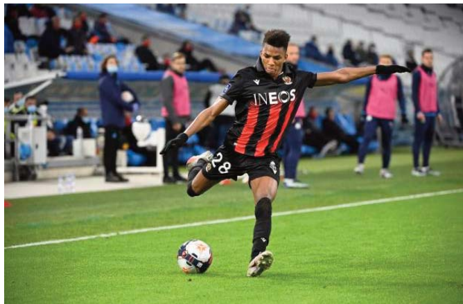
en qualifications de la Coupe d'Afrique des nations CAN 2021 contre respectivement la Zambie (3-3) et le Botswana (5-0) en mars dernier.