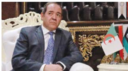
libyen au niveau du conseil présidentiel, du gouvernement d'union nationale et du Haut Conseil d'Etat, et ce pour examiner les relations bilatérales sur tous les plans et les perspectives du processus de règlement politique de la crise libyenne", selon la même source.

"Le ministre des Affaires étrangères effectuera, aujourd'hui, une visite de travail en Libye, pays frère, en compagnie du ministre de l'Intérieur, des Collectivités locales et de l'Aménagement du territoire, M. Kamel Beldjoud, en compagnie d'une délégation de haut niveau", lit-on dans le communiqué. Accompagné d'une délégation, M. Boukadoum aura des rencontres avec des hauts responsables du nouveau pouvoir exécutif