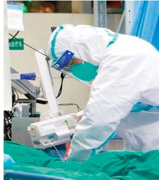
(30.874.376 cas), le Mexique avec 234.969 morts (2.590.500 cas), et le Pérou avec

Après les Etats-Unis, les pays les plus touchés sont le Brésil avec 533.488 morts et 19.089.940 cas, l'Inde avec 408.764 morts