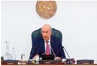
Président de la République, un exposé de Monsieur le Premier ministre portant me-

L'ordre du jour de cette réunion prévoit: "l'installation officielle du Gouvernement par le