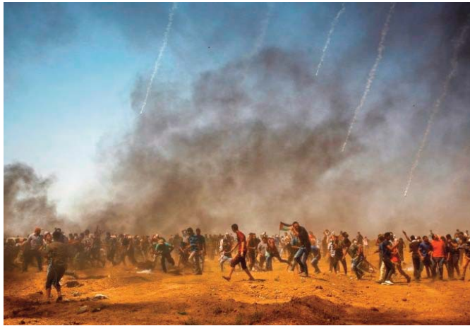
l'après-midi dans la localité de Beita, point chaud ces derniers mois, pour protester contre la colonie sioniste d'Eviatar, située à proximité.

Des heurts ont opposé vendredi des Palestiniens manifestant contre la colonisation israélienne et des soldats israéliens en Cisjordanie occupée, faisant 320 blessés palestiniens, la majorité par des gaz lacrymogènes, ont indiqué les services de secours du Croissant-Rouge palestinien. Ces derniers ont aussi fait état de 21 personnes touchées par des balles réelles et 68 par des balles en caoutchouc. Des centaines de Palestiniens s'étaient rassemblés dans