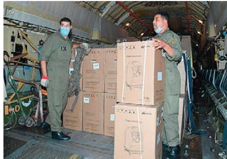
Forces aériennes ont atterri, la nuit d'hier dimanche 25 juillet 2021 à la base aérienne de Boufarik, avec à leur bord

Une première livraison de concentrateurs d'oxygène (1050 unités), acheminée par des avions militaires relevant des Forces aériennes, a été reçue, dimanche soir au niveau de la base aérienne de Boufarik (Blida), dans le cadre de la lutte contre la pandémie du Coronavirus, indique lundi le ministère de la Défense nationale. "Dans le cadre du renforcement des efforts du système sanitaire national, et afin de garantir les moyens nécessaires pour la prise en charge des malades touchés par le Coronavirus, deux (02) avions militaires relevant de nos