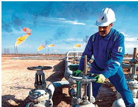
aux Etats-Unis, l'American Petroleum Institute (API) a rendu compte d'une baisse des stocks de brut de près de 4,8 millions de barils. Les stocks d'essence ont même

En effet, les fortes variations de prix de la semaine dernière ont fait place à des séances "plus calmes" cette semaine, notent les analystes, qui évoquent le "bras de fer" actuel entre les préoccupations liées au variant Delta et un marché du brut attendu en déficit. Mardi, la fédération qui regroupe les professionnels du secteur pétrolier