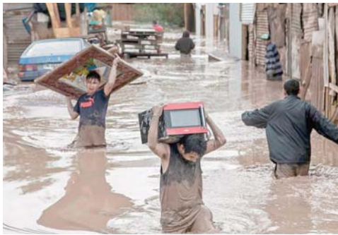
de Merida (ouest), précisant que toute la zone était privée d'électricité et de téléphone tandis que les accès sont bloqués par les eaux. "La situation est dramatique, triste, désespérante.