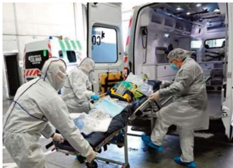
Université Johns Hopkins.

Les Etats-Unis sont le pays le plus touché tant en nombre de morts que de cas, avec 630.816 décès pour 38.075.085 cas recensés, selon le comptage de l'université Johns Hopkins.