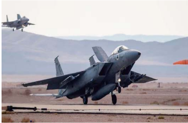
tion basée au Royaume-Uni et qui dispose d'un vaste réseau de sources en Syrie, les frappes israéliennes ont ciblé un entrepôt de drones.