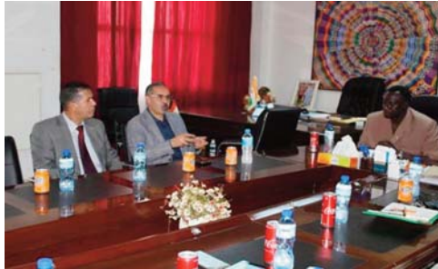
autres dossiers d'intérêt commun", selon la même source. Étaient présents à cette réunion, des cadres supérieurs

Les deux ministres ont présidé une réunion qui a porté sur plusieurs axes dont "les voies et moyens susceptibles de développer et de renforcer la coopération bilatérale dans le domaine de la jeunesse et des sports, en sus de plusieurs