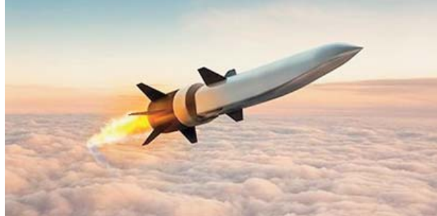
testé en août un missile hypersonique à charge nucléaire, difficile à contrer, et que Pékin développait cet arsenal beaucoup plus vite que prévu.

Les Etats-Unis ont testé en octobre avec succès la technologie des missiles hypersoniques, déjà utilisée par la Russie ou la Chine. Le Pentagone a récemment confirmé que la Chine avait