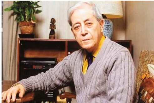
Pour célébrer le centenaire de naissance de Mohammed Dib, les organisateurs ont convié aux côtés du grand romancier, les peintres qu'il a connus et appréciés, ses proches dans

Intitulée, «Mohamed Dib et l'Art: le regard pour ombre», cette exposition, organisée par le Cca, en partenariat avec la Société Internationale des Amis de Mohammed Dib, rendra hommage à l'«artiste que fut également Mohamed Dib» qui avait toujours manifesté un intérêt pour les arts et s'était «essayé durant sa jeunesse à la peinture», faisant apparaître les «aspects picturaux» dans son œuvre, rappellent les organisateurs.