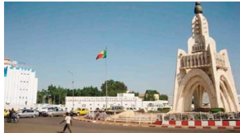
La médiation veut des avancées sur les réformes institutionnelles

L'armée ougandaise a annoncé, mardi, avoir lancé des frappes conjointes avec l'armée congolaise contre les positions des Forces démocratiques alliées (ADF) dans l'est de la République démocratique du Congo (RDC). «Ce matin, nous avons lancé des frappes aériennes et d'artillerie conjointes contre les camps des ADF avec nos alliés congolais», a déclaré l'armée ougandaise sur Twitter. «Comme annoncé, les actions ciblées et concertées avec l'armée ougandaise ont démarré aujourd'hui avec des frappes aériennes et des tirs d'artillerie à partir de l'Ouganda sur les positions des terroristes ADF en RDC», a ajouté de son côté le ministre congolais de la Communication, Patrick Muyaya, porte-parole du gouvernement. Les ADF sont accusés de centaines de massacres ayant fait des milliers de morts dans deux provinces congolaises frontalières avec l'Ouganda.