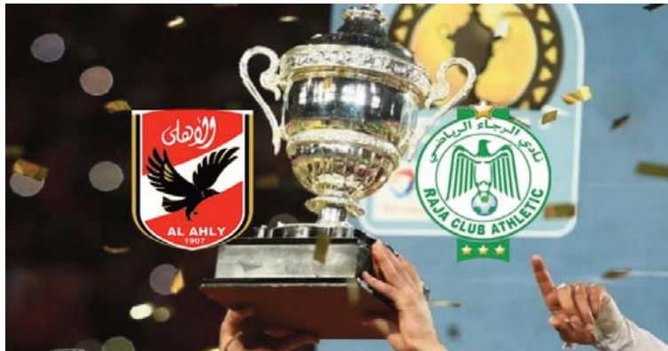
Confédération africaine. La Supercoupe aura lieu à Doha, quelques jours après la finale de la Coupe arabe, qui se déroule actuellement dans la capitale qatarie.

Les Egyptiens disputeront cette rencontre en tant que champion de la Ligue des champions d'Afrique, tandis que le Raja y participera après avoir remporté la Coupe de la