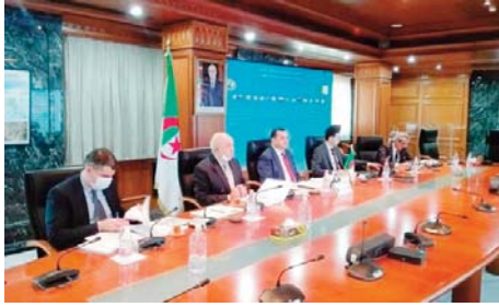
L'année 2021, seront, également, à l'ordre du jour de cette réunion ministérielle, a ajouté le communiqué.

D'autres questions organisationnelles et l'évaluation des activités de cette organisation, dont la présidence est assurée par l'Algérie pour