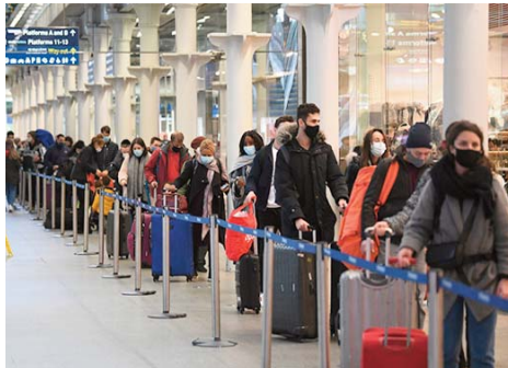
schéma vaccinal complet.

Et il n'y aura plus de quarantaine pour les personnes cas contact disposant d'un