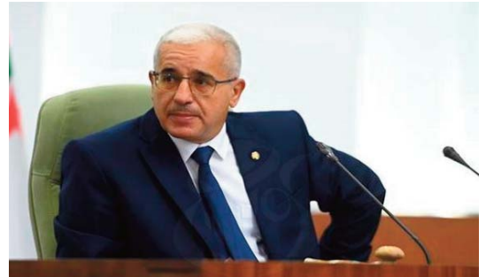
Le président de l'APN et les députés en reconnaissance des facilitations accordées lors de l'organisation du salon.

À la fin de l'atelier, les ouvrages réalisés ont été offerts à l'APN. L'association «Lamasat» a ho-