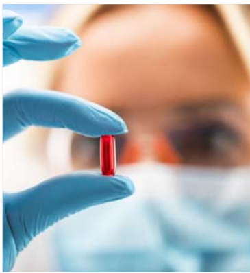
l'ABX464, le laboratoire a procédé à une étude clinique. Pendant huit semaines, le médicament intégrant l'ABX464 – sous forme d'un seul comprimé à avaler quotidiennement – à 20 patients tandis que 10 autres malades prenaient un placebo. L'étude était conduite à l'aveugle : ni

La rectocolite hémorragique est une maladie inflammatoire chronique touchant le rectum et le côlon. Au quotidien, les patients souffrent de crampes intestinales douloureuses et sont contraints de se rendre aux toilettes une dizaine de fois par jour. Aujourd'hui, il n'existe pas de traitement, seulement des médicaments pour diminuer l'inflammation responsable de la maladie et pour soulager les principaux symptômes. L'efficacité d'une molécule déjà testée sur le virus VIH,