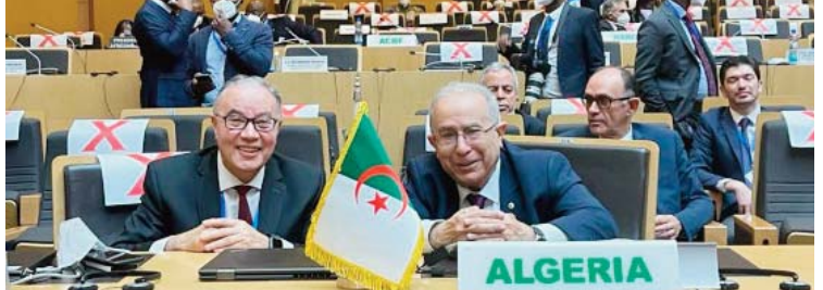
met, du président de la République du Congo (RDC), Félix Tshisekedi, au président de la République du Sénégal, Macky Sall.

paix, à la sécurité, à la gouvernance, à la réforme institutionnelle de l'UA, aux efforts communs du continent en vue de lutter contre les retombées de la pandémie de Corona, ainsi qu'à la coopération économique. Cette session connaîtra le passage de la présidence du som-