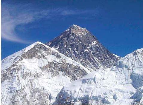
Le Col Sud se situe à environ 7.900 mètres au-dessus du niveau de la mer et à un kilomètre sous le sommet de