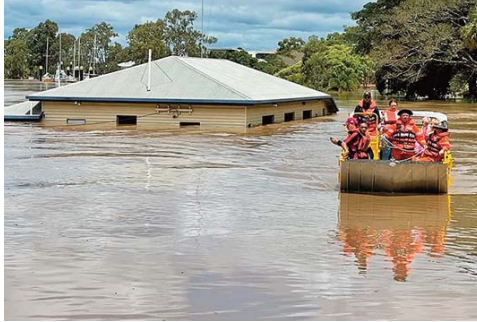
dans le pays «Aujourd'hui, nous attendons de fortes précipitations dans l'après-

Les eaux de crue ont emporté des voitures et forcé des dizaines de milliers de personnes à évacuer leurs maisons dont les balcons et les toits ont été complètement submergés. «C'est terrible. Une vie perdue, c'est (une vie de) trop», a déclaré Paul Toole, vice-premier ministre de l'Etat de Nouvelle-Galles du Sud, après avoir confirmé mercredi un troisième décès dans la ville de Lismore, portant le bilan total à 12 morts