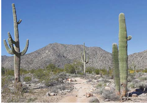
Les hauts lieux de la biodiversité riches en différentes

Quelque 1.500 espèces de cactus réparties sur le continent américain vivent sous des climats différents, allant des déserts situés au niveau de la mer aux hautes montagnes des Andes, des écosystèmes arides aux forêts tropicales humides. Parmi