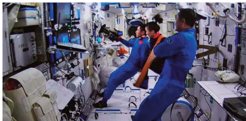
Les membres d'équipage de Shenzhou-13, à savoir Zhai Zhigang, Wang Yaping et Ye Guangfu, se sont préparés pour la séparation, et le site d'atterrissage de Dongfeng fait actuellement les préparatifs pour le retour des trois astronautes, selon la CMSA.

Ayant achevé toutes les tâches prévues, le vaisseau spatial habité Shenzhou-13 se séparera du module central Tianhe de la station spatiale au moment opportun et atterrira au site d'atterrissage de Dongfeng, dans la région autonome de Mongolie intérieure, dans le nord de la Chine, a indiqué jeudi l'Agence chinoise des vols spatiaux habités (China Manned Space Agency, CMSA).