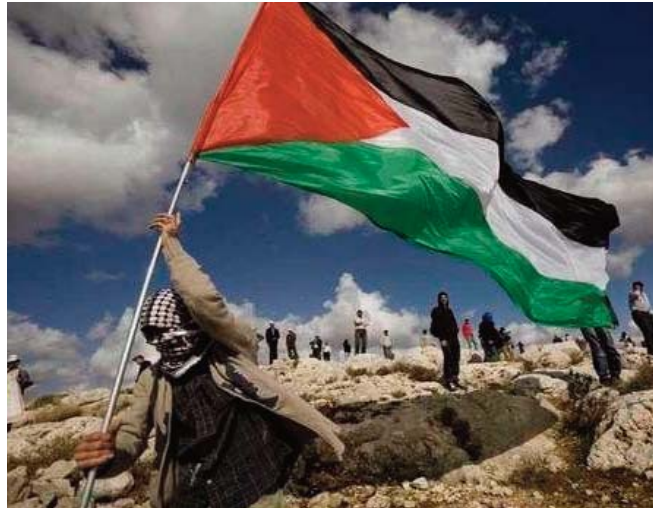
aussi l'espace aérien et les eaux territoriales de l'enclave, ainsi que deux des trois points de passage frontaliers, le troisième étant contrôlé par l'Egypte.

Depuis 2007, l'occupant sioniste a imposé un siège à la population de Ghaza, qui compte plus de deux millions de Palestiniens, ce qui a entraîné une détérioration significative des conditions de vie et de la situation économique. L'occupant contrôle