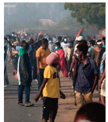
de plusieurs épisodes de violence au Darfour ces derniers mois, selon l'ONU.

"Actuellement, la normalité est revenue et les gens vaquent à leurs occupations habituelles, car des agents de sécurité ont été déployés pour effectuer des patrouilles et des contrôles de visibilité afin d'éviter que l'attaque ne se reproduise", a précisé le responsable policier.