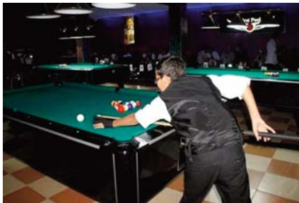
Jeux africains de la Jeunesse, septembre prochain en Egypte, a fait savoir Maldi.

Cette compétition continentale sert de tremplin en vue des Jeux méditerranéens d'Oran-2022 en juin prochain, des Jeux de la Solidarité islamique en août prochain en Turquie, et des